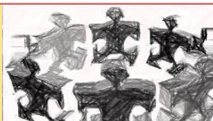
TAVOLA ROTONDA 1