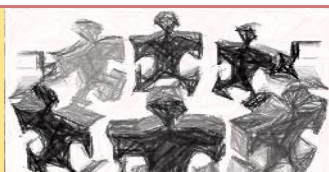
TAVOLA ROTONDA 3

“DSA e lingua straniera: strategie, strumenti e tecnologie” “Il metodo The Square”