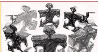
TAVOLA ROTONDA 1