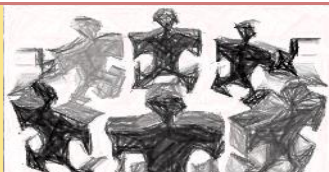
TAVOLA ROTONDA 2